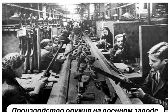
Производство оружия на военном заводе

В осаде города продолжали работать свыше 200 предприятий, в том числе семь судостроительных заводов, выпустивших за это время 13 подводных лодок. Промышленность осажденного Ленинграда произвела 150 образцов военной продукции. Всего в годы блокады ленинградские предприятия произвели около 10 миллионов снарядов и мин, 12 тысяч минометов, 1,5 тысячи самолетов, были изготовлены и отремонтированы 2 тысячи танков. Несмотря на бомбежки, даже зимой 1941-1942 годов в городе шли спектакли и музыкальные представления. В марте 1942 года по городу вновь начали ходить трамваи, а в мае на стадионе «Динамо» на Крестовском острове прошел первый футбольный матч.