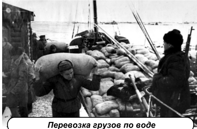
Перевозка грузов по воде

В навигационные периоды перевозки проводились по водной трассе, в период ледостава – по ледовой дороге на автотранспорте. Ледовая трасса, названная ле-