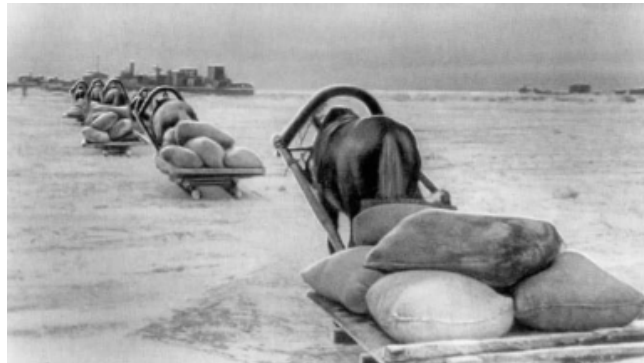
Доставка продовольствия по «Дороге жизни»

нинградцами «Дорогой жизни», вступила в действие 22 ноября 1941 года. По ней подвозили боеприпасы, оружие, продовольствие, топливо, эвакуировали больных, раненых и детей, а также оборудование для заводов и фабрик. Всего за время функционирования магистрали по ней были эвакуированы около 1 млн. 615 тысяч тонн грузов.