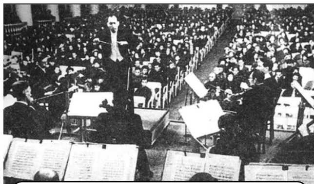
Концерт как символ несокрушимости духа

18 января 1943 года Красная Армия сумела прорвать блокаду Ленинграда и начать процесс снабжения города (увы, далеко не всегда даже после прорыва блокады, была возможность снабжать горожан всем необходимым) и эвакуации голодающих детей, женщин, раненых, стариков. До полного снятия блокады городу предстояло продержаться еще 374 дня, до 27 января 1944 года. Но этот день стал для ленинградцев и тех, кто оказался в кольце блокады вместе с горожанами, величайшей победой Красной Армии. 27 января 1944 года Ленинград был полностью освобожден. В честь одержанной победы в городе прогремел салют в 24 артиллерийских залпа 324 орудий. Это был единственный за все годы Великой Отечественной войны салют (1 степени), проведенный не в Москве.