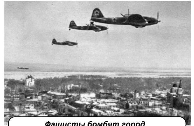
Фашисты бомбят город