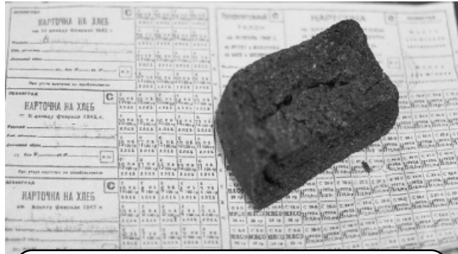
Хлебная карточка и фронтовой паек хлеба

Постепенно в городе иссякли запасы топлива, воды, прекратилась подача света и тепла. Осенью 1941 года начался голод. Была введена карточная система снабжения горожан продовольствием. Нормы выдачи хлеба для рабочих к 20 ноября 1941 года опустились до 250 граммов в день, а для остального населения – до 125 г.