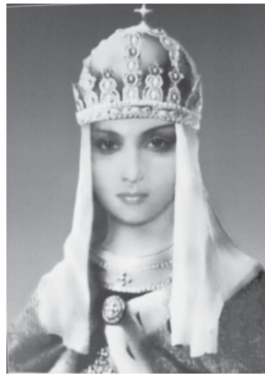
Иоанна Васильевича родился сын Василий (1563г.), который умер в младенчестве.

Родилась в Малой Кабарде. Младшая дочь верховного князя Кабарды Темрюка Идарова. В девичестве Гуащэнэй, приняла крещение и была названа Марией. 21 августа 1561г. русский царь сочетался с ней вторым браком. Этим браком был укреплен военно-политический союз Российского государства и Кабарды. У Марии Темрюковны и