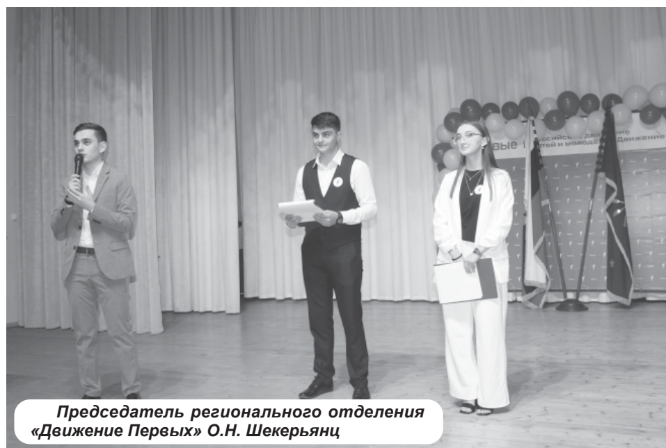
Председатель регионального отделения «Движение Первых» О.Н. Шекерьянц

Поздравляя с открытием местного отделения, председатель регионального отделения «Движение Первых» О.Н. Шекерьянц поблагодарил районную администрацию за поддержку и выразил уверенность в том, что в новом движении молодежь найдет не только