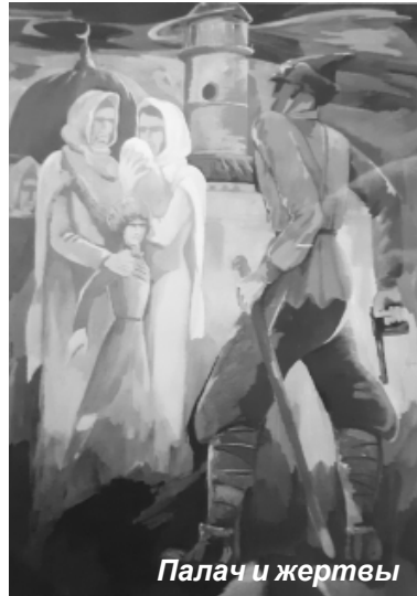
Палач и жертвы

Но природный талант и неистовая тяга к искусству взяли верх. Мальчик тайком, зачастую при слабом освещении, делает на-