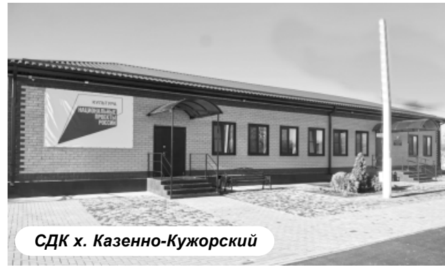
СДК х. Казенно-Кужорский

полнительные клубные формирования, различные кружки и любительские объединения, как для детей, так и для взрослых, такие как рукоделие, художественное творчество, музыкальные и танцевальные коллективы. СДК сегодня - один из немногих доступных источников приятных эмоций. Сюда люди могут прийти отдохнуть, отвлечься от повседневных дел. Для сельчан это особенно важно.