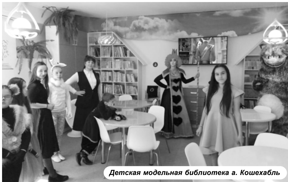
Детская модельная библиотека а. Кошехабль

Цель нацпроекта - увеличить к 2024 году число граждан, вовлеченных в культуру, путем создания современной инфраструктуры культуры, внедрения в деятельность организаций культуры новых форм и технологий, широкой поддержки культурных инициатив, направленных на укрепление российской гражданской идентичности.