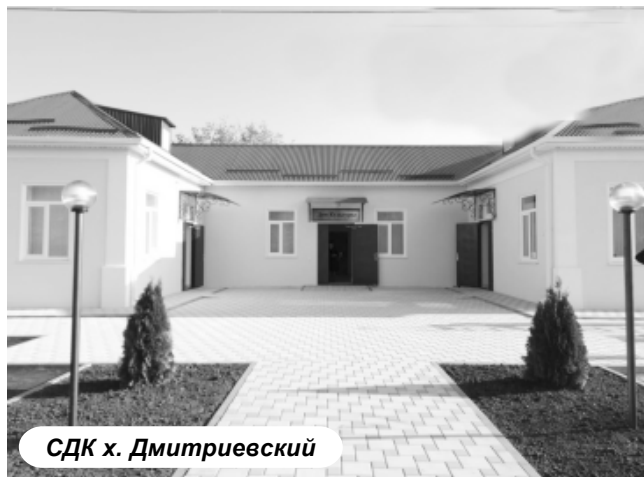
СДК х. Дмитриевский

Другим существенным дополнением стали современные компьютеры и мультимедийная техника. Пространство проработано таким образом, чтобы разные группы посетителей не мешали друг другу. Библиотека разделена на следующие зоны: «Двор детства», «Виртуальный мир», «Этнографическая зона», «Ресепшен», «Читальный зал», «Абонемент».