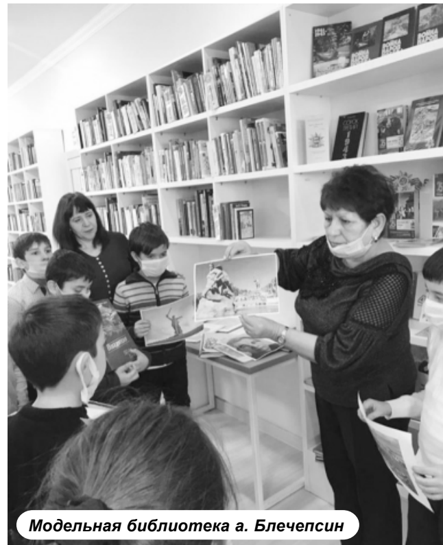
Модельная библиотека а. Блечепсин

Значение данных преобразований трудно переоценить, так как сельский Дом культуры - это не только место, где проходят различные праздники, но и сходы, собрания жителей. Более того, в филиале СДК х. Казенно-Кужорский в различных коллективах занимаются более 90 участников, а в новых условиях появились до-