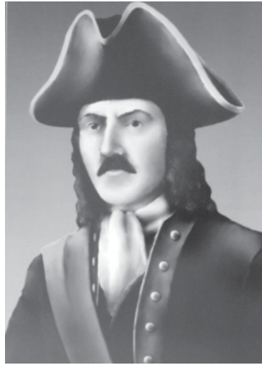
вестный картограф Александр (Долетгерий) Бекевич-Черкасский (1671-1717)

Из кабардинского княжеского рода Бекмурзиных. В 1690г. уе-